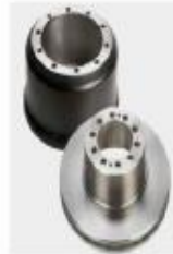
TAMBOR DE FRENO