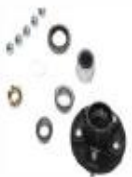
BUJES PARA CAMION Y REMOLQUE