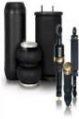
FUELLES Y AMORTIGUADORES SABO TODAS LAS APLICACIONES CAMION Y REMOLQUE