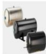
CALDERINES DE HIERRO Y ALUMINIO