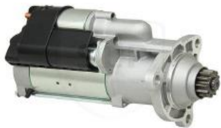
Motor de Arranque