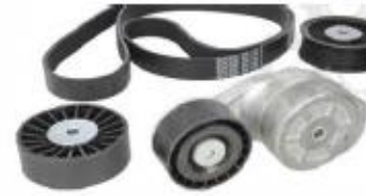
Poleas y tensores para camión