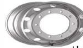
Llanta de Aluminio y Hierro, ALCOA Y ACCURIDE