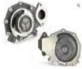
BOMBAS DE AGUA OMP TODAS LAS APLICACIONES CAMION