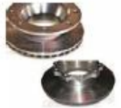
DISCO DE FRENO PARA CAMION Y REMOLQUE DENAPARTS