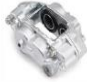
PINZA DE FRENO DENAPARTS