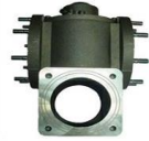
COLECTOR NEUMATICCO VC4N 530,51€